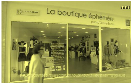
Boutique éphémère – Marseille

En cohérence avec le contenu pédagogique, l'approche fondamentale de l'Ouvre-Boîte est le « learning by doing ». Conscient de la faible appétence des jeunes pour le système scolaire traditionnel, nous avons voulu construire notre dispositif d'accompagnement en nous appuyant sur l'apprentissage par l'expérimentation.