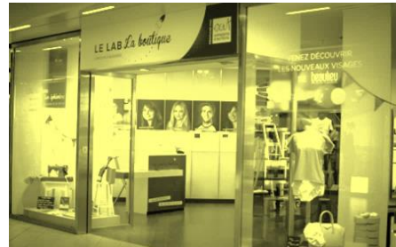
Boutique éphémère - Nantes

En ayant recours à des boutiques éphémères dans des lieux commerciaux de premier choix, l'opportunité est donnée à des jeunes créateurs de bénéficier d'un flux de clientèle important pour expérimenter son projet en grandeur réelle, sans avoir à supporter les risques financiers associés. L'Ouvre Boîte offre donc à ces derniers la possibilité de tester leur offre, de se confronter à la relation client, aux objections de la clientèle, de confirmer/infirmier un prix de vente et plus généralement de valider leurs hypothèses économiques à partir d'une expérience terrain quotidienne.